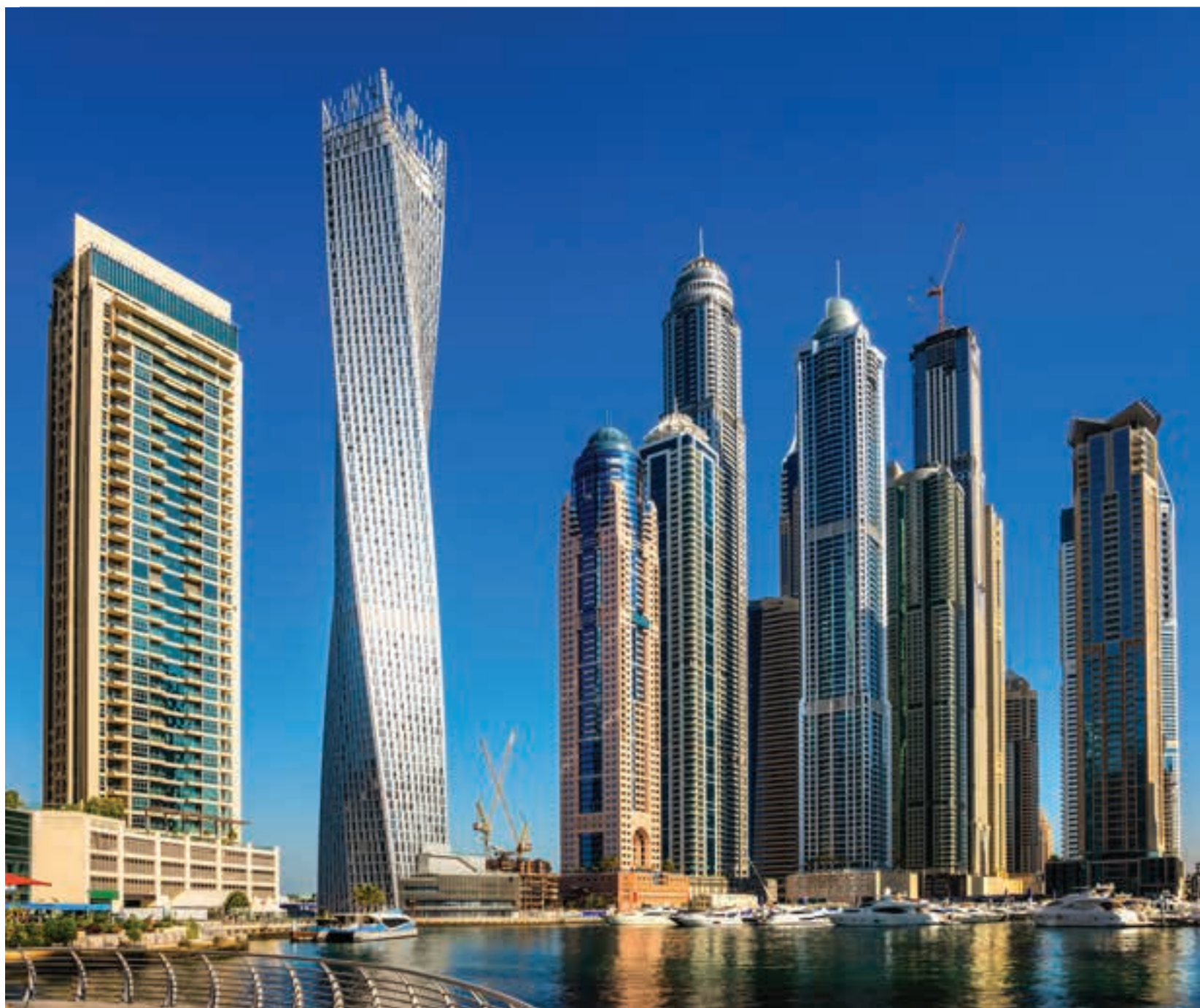
Infinity Cayan Tower